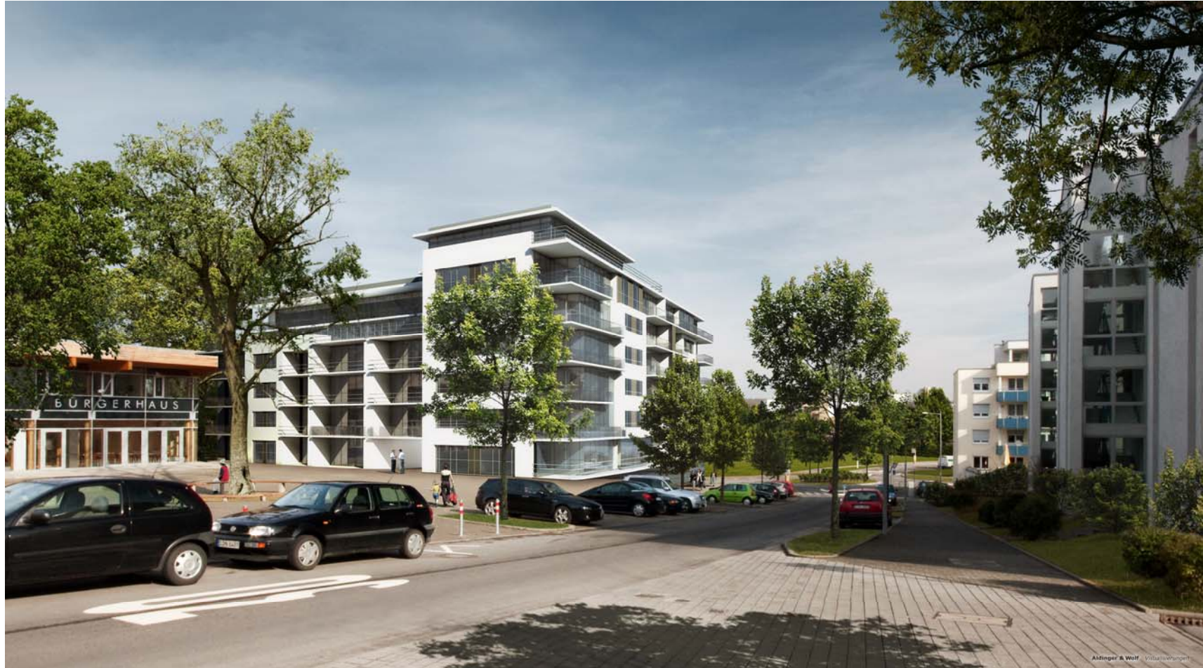
Ansicht Meluner Straße